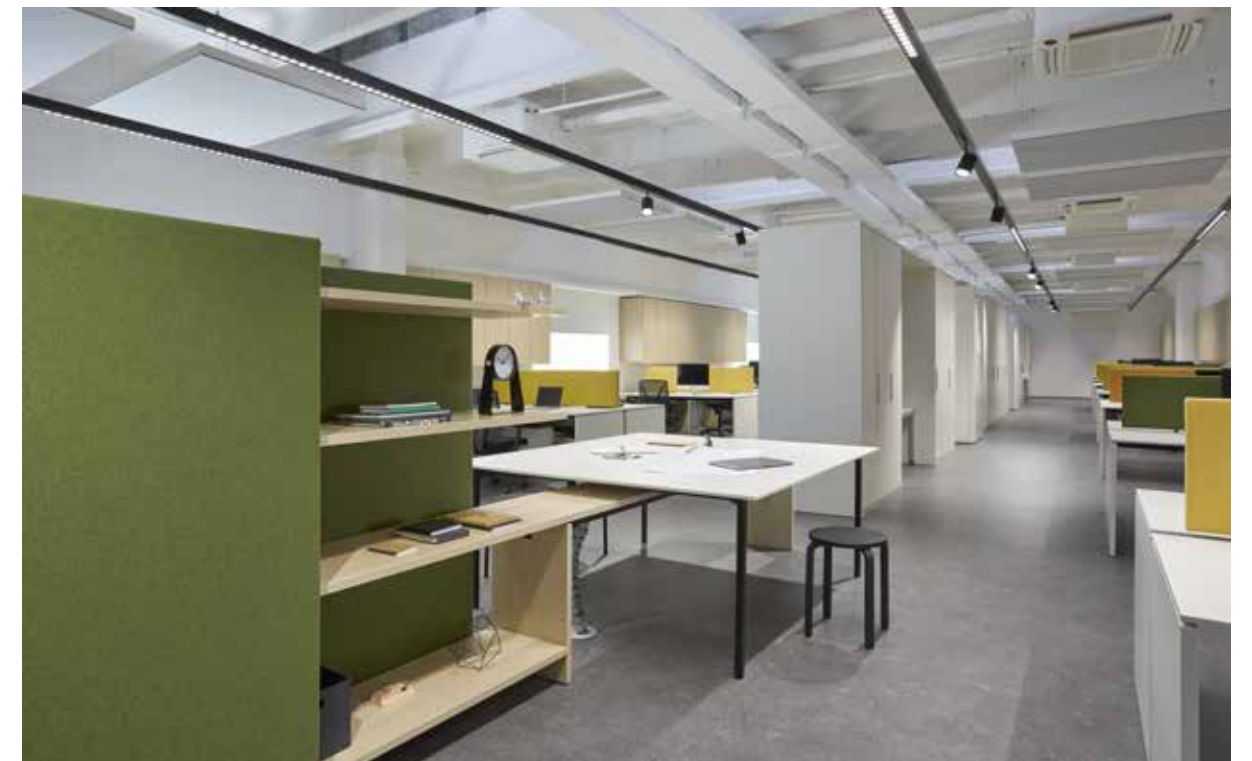
angolo riunione con librerie acustiche/ meeting corner with soundproofing bookcases