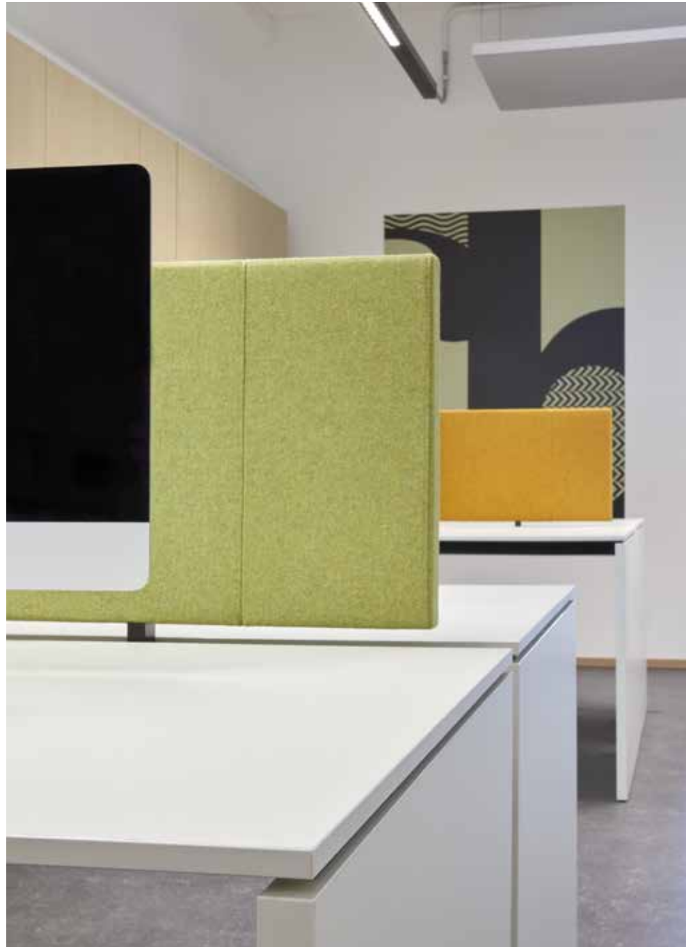
postazioni operative con schermi acustici/ operational workstations with acoustic screens