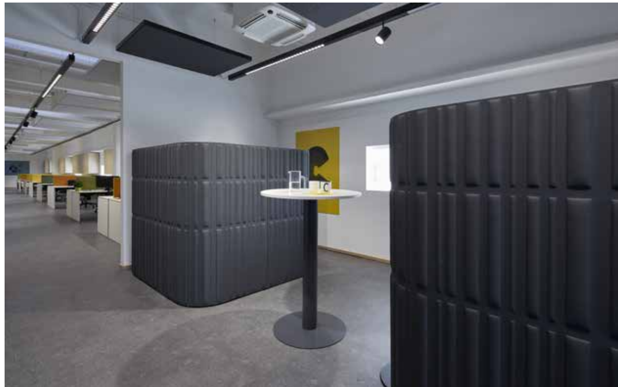
area break con schermi acustici Islands/ break area with Islands acoustic screens