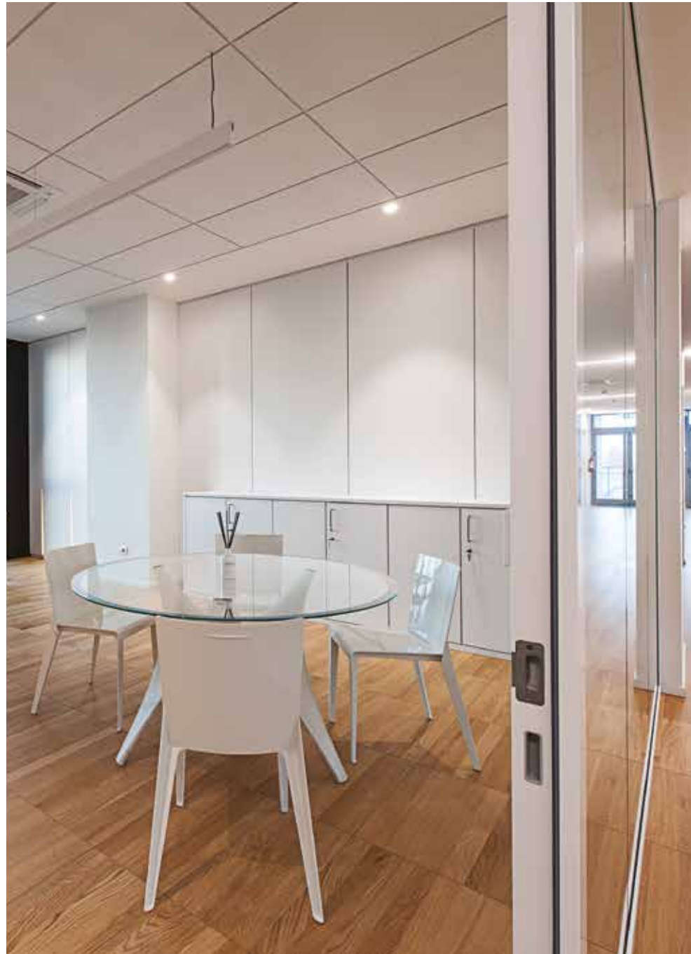
parete divisoria Basic/ Basic partition wall