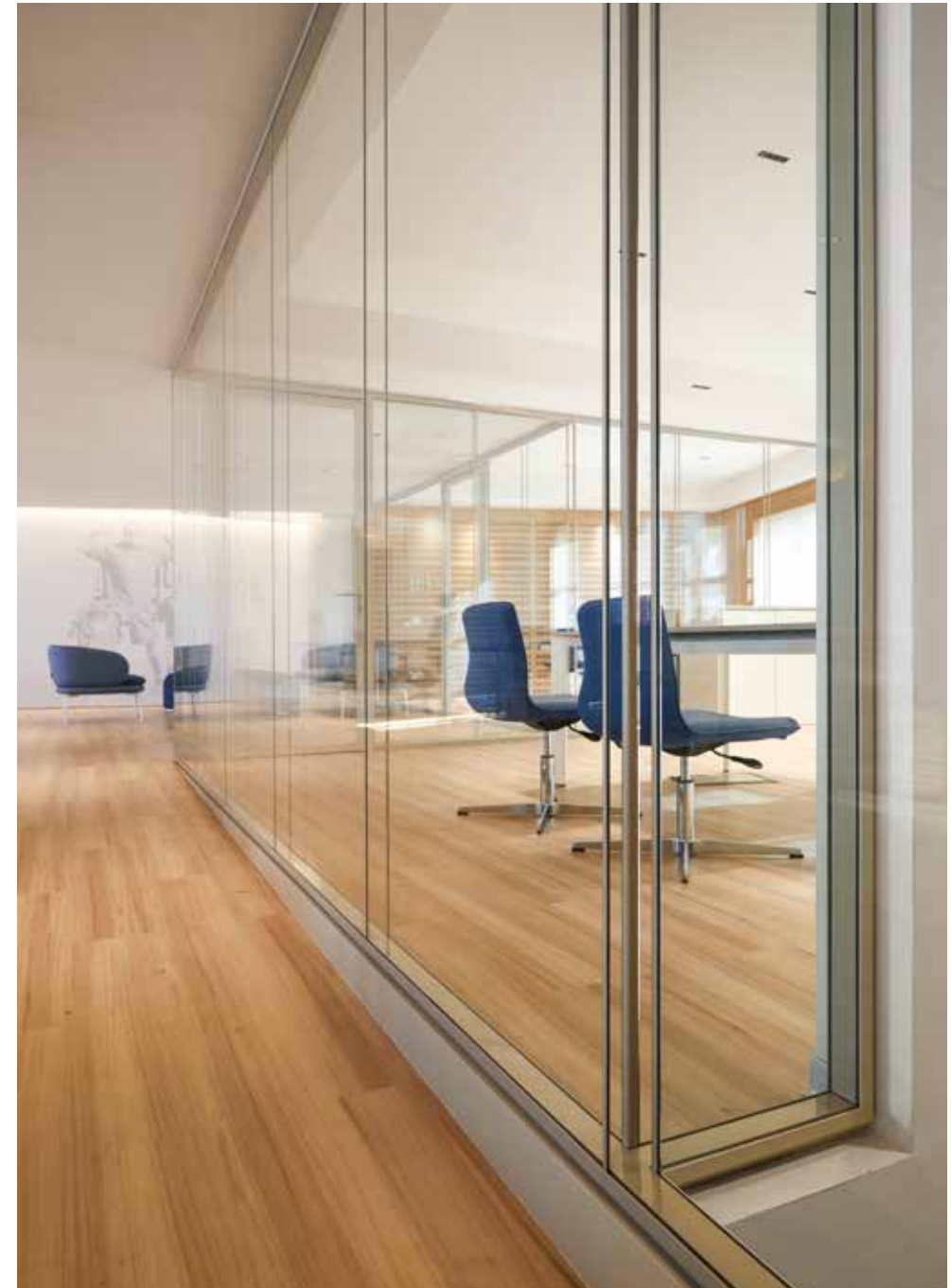
parete divisoria doppio vetro Vision/ Vision double-glass partition wall