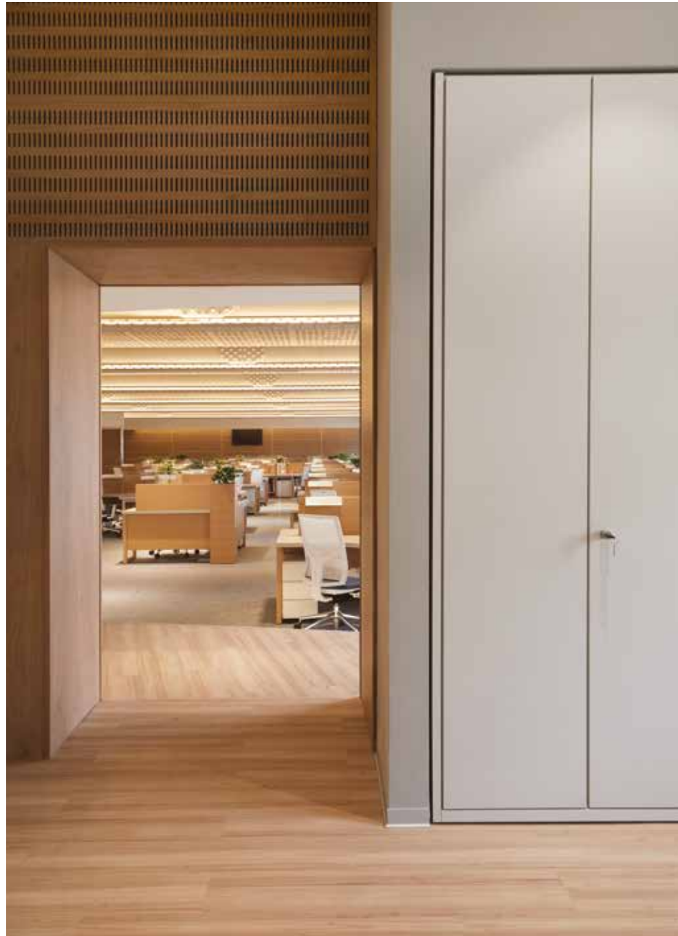
boiserie in legno con pannelli acustici/ wooden boiserie with acoustic panels